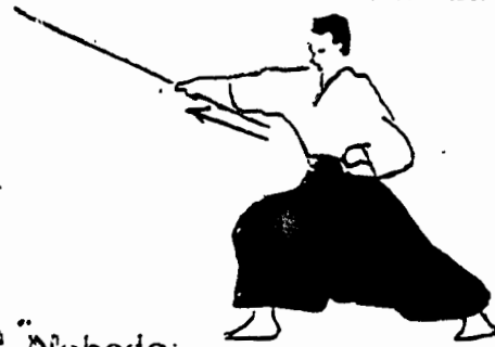
Nobedo: Golpe de extensión, cambiar las manos en el Bo para técnica de alcance extendida.