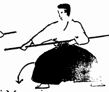
Koshi Mawari: Vuelta de cadera con la técnica para el shittei uchi, pero de lado.