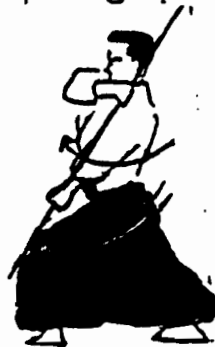
Sune Uchi: Golpe hacia la canilla con el Bo.